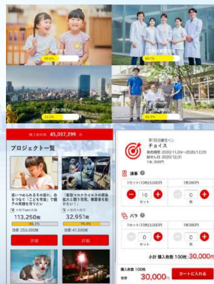
「チョイス」販売サイトのイメージ

夢を実現するデジタル宝くじ「チョイス」への共感者を得て支援の拡大と全国の地域活動活性化をめざす