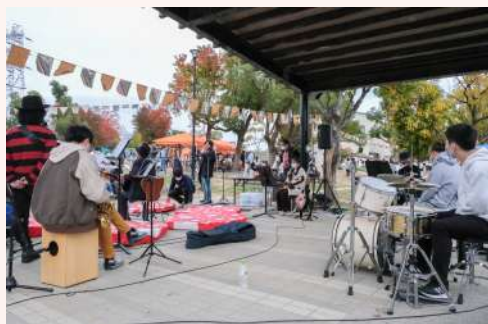
野田中央公園での演奏の様子