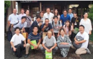
↑9月11日、京北地域にてフィールド調査を実施。地域の現状を伺う。