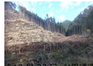
↑10月23日、台風通過後の被災地。