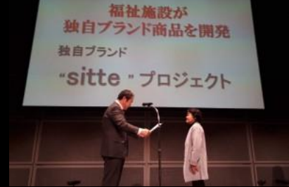
<メンバーの介護事業者の取組>

② 社会的弱者、要庇護者と思われがちな高齢者や子供・若者と、産業基盤が弱体化した林業が組み合わせられることで新たな関係性や価値の創出という「 つながり 」による イノベーション を起こす！