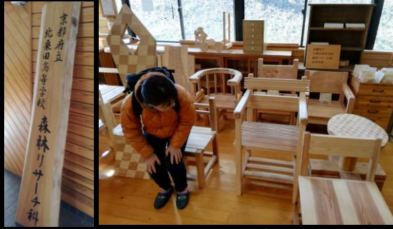
<高校生の木工作業は既にプロレベル！>

①「持続可能性×林業・森林」に共感したメンバーが互いにつながり、継続性のある本業あるいは有償の事業として関わることで、継続性、推進力、他地域への展開力の高い 持続可能な取組 を目指す！