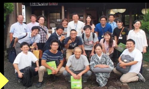
<京都市北部山間地域(京北地域)で開催したワークショップ後の一コマ>