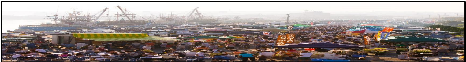
※八戸観光情報サイト観光Navi

八戸市中心街を活性化でき館鼻岸壁朝市の問題点も解決できる。マチニワで開催することによって以上のようなメリットが挙げられる。