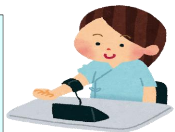
※イラスト屋 (イラスト)