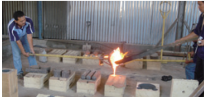
インドネシア鑄造企業にて

実験が行えない場合には、因果関係の計測は困難です。例えば、開発援助による途上国労働者への技術研修プログラムの効