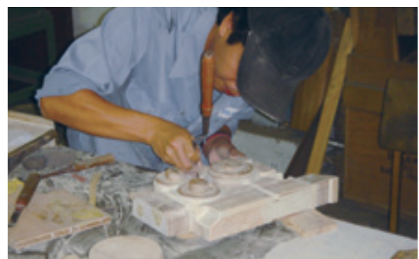
日本の技術援助の現場