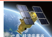
0.5m(白黒), 2m(カラー)