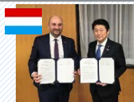
ルクセンブルク副首相と、宇宙資源等に関する覚書に署名。