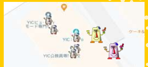
チョココクン対策マップ