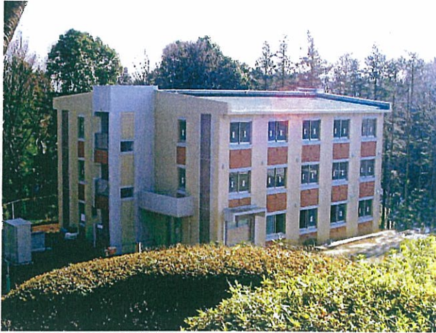
留学生会館の外観