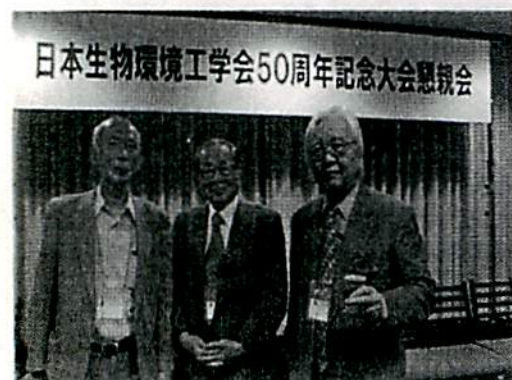
写真13 懇親会(受賞招待者)