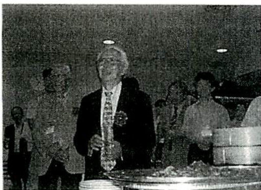
写真15 懇親会 (受賞招待者)