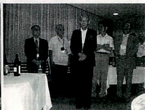
写真14 懇親会(受賞招待者)