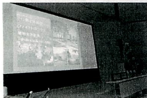
写真11 シンポジウム 講演風景