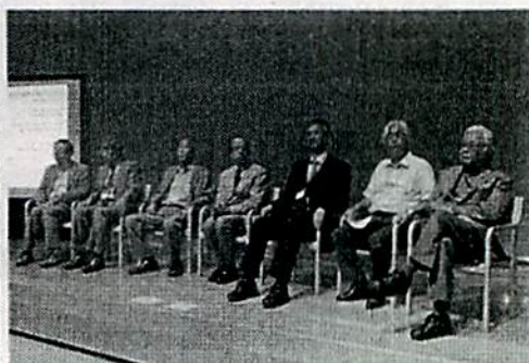
写真12 シンポジウム 総合討論