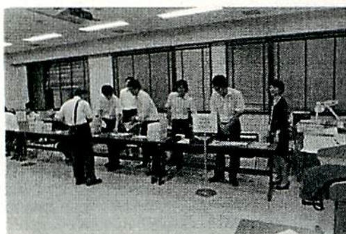
写真1 大会会場の受付