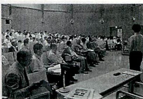
写真10 シンポジウム会場