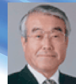
柘植 綾夫 芝浦工業大学学長