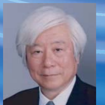
吉川 弘之 産業技術総合研究所理事長