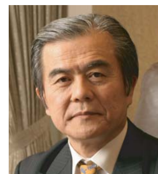
小宮山 宏 東京大学総長