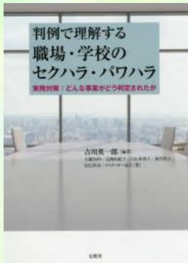
[ハラスメント] 366.3 / H29