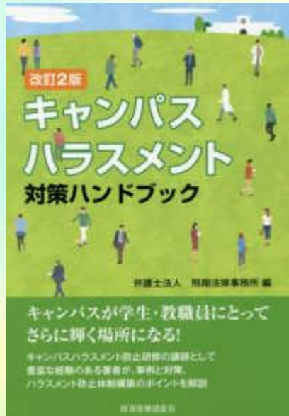
[ハラスメント] 377.1 / Ky1