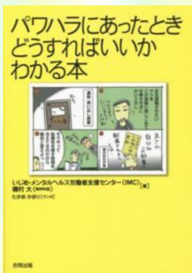
[ハラスメント] 366.3 / P28