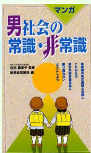
[性差] 367 / O86