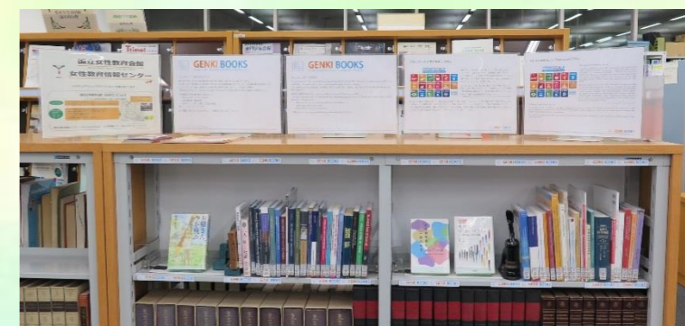
工2号館図書室に設置された GENKI BOOKS コーナー