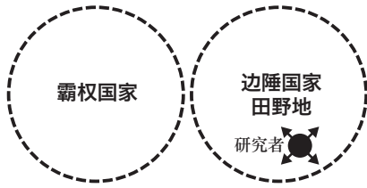
【图一】民俗学中研究者与社会之间的关系